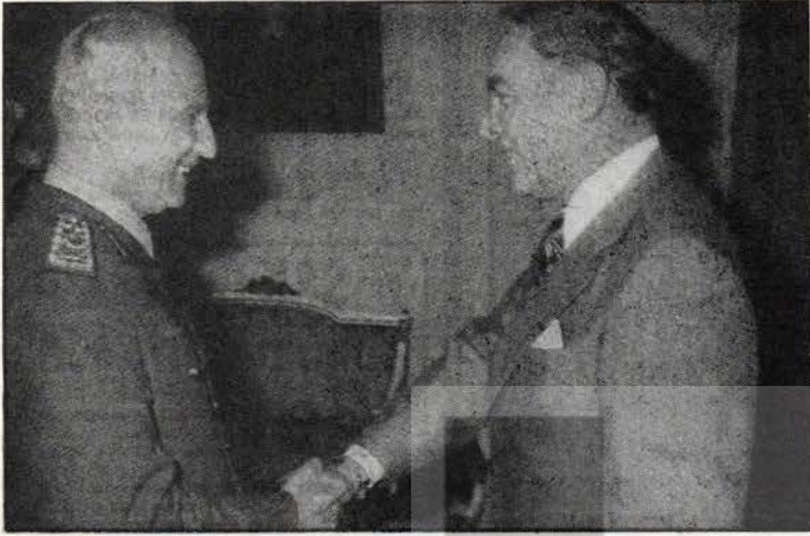
Türkiye'ye yerleştirilecek "çevik müdahale gücü", ABD'nin Basra Körfezi'ndeki çıkarlarını koruyacak...

Ankara cuntasının ABD yönetiminin Orta Doğu'daki saldırgan emellerine hizmet yolunda ne gibi çılgın maceraları göze aldığı ve Türkiye'yi nelere alet etmeye hazırlanmakta olduğu gittikçe daha belirgin bir şekilde ortaya çıkmaktadır. Bilindiği gibi Mayıs ayında NATO Dışişleri Bakanlarının Lüksemburg toplantısında, NATO'nun hareket alanının genişletilmesi ilke kararı alınmış ve bu çerçevede içinde ABD "çevik müdahale gücü"ne Türkiye'de her türlü imkan ve kolaylığın sağlanmasının çoktan kararlaştırıldığı ve bu amaçla Doğu Anadolu'da çeşitli uygulamaların başlatılmış olduğu da ABD Dışbakanı Haig'in Ankara ziyaretinden sonra hiç bir yalanla üstü örtülemez bir biçimde açığa çıkmıştı.