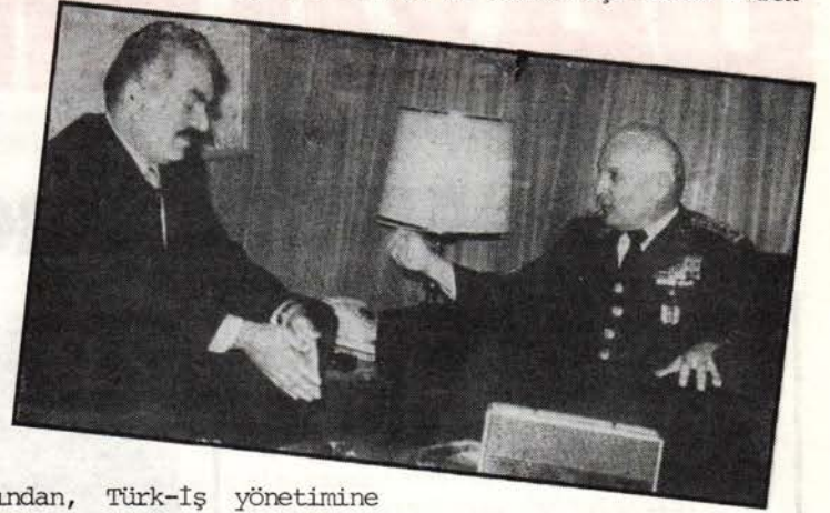
İki işçi düşmanı başbaşa: Türk-İş Başkanı Şevket Yılmaz ve Cunta Başlı Kenan Evren

Yıllardır Türk-İş tabanında sosyal-demokrat üyeler ve sendikacılar çoğunlukta olmalarına rağmen, ideolojileri gereği burjuvazi ile sınıf işbirliğini savundukla-